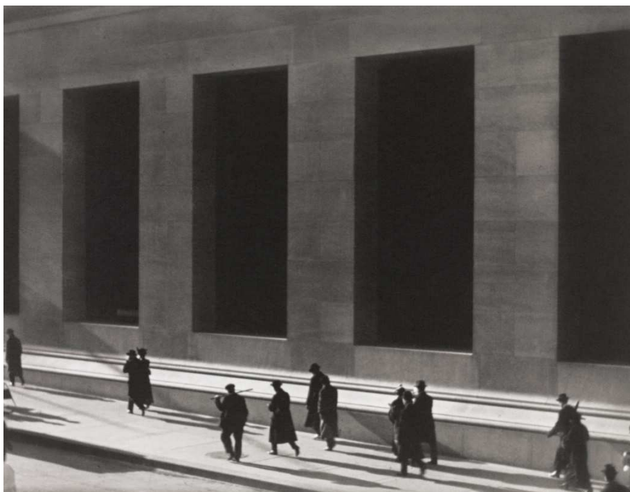
Wall Street, New York, 1915 [Wall Street, Nueva York, 1915] Impresión al platino paladio

Uno de los elementos con los que Strand aprendió a trabajar en los inicios de su carrera tras un período pictorialista fue con el movimiento de los peatones desplazándose por la calle. A instancias de Stieglitz y siguiendo a Alvin Langdon Coburn (1882-1966), comenzó a fotografiar desde los viaductos, puentes y edificios altos de la ciudad. Estas imágenes y su movimiento introdujeron un rasgo documental y de cotidianeidad en su obra que se convertirá en uno de los elementos característicos de la fotografía urbana del siglo XX.