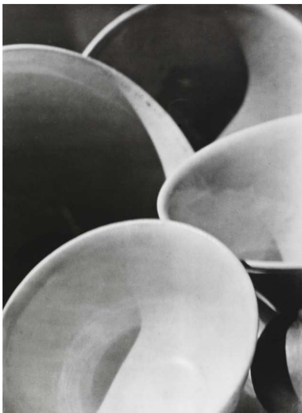
Abstraction, Bowls, Twin Lakes, Connecticut, 1916 [Abstracción, tazones, Twin Lakes, Connecticut, 1916] Plata en gelatina Colecciones Fundación MAPFRE

El paisaje fue uno de los géneros románticos por excelencia. La visión directa de la naturaleza alejaba a los artistas del concepto de mimesis en favor de una pintura que transmitiera sensaciones. El pictorialismo fotográfico, muy influido por este modo de ver el arte y las enseñanzas del acuarelista y dibujante Alexander Cozens (1717-1786), que desarrolló una teoría del arte basada en la reducción y simplificación de las formas, influyó en gran medida en el primer Strand. Fotografías como El río Neckar, Alemania, 1911 , Bahía de Shore, Long Island, 1914 o Invierno, Central Park, Nueva York, 1913-14 , son algunos de los ejemplos que ilustran el camino hacia la abstracción que exploró a través de este género.