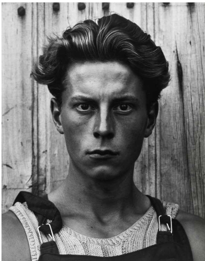
Young Boy, Gondeville, Charente, France

El recorrido se divide en cuatro secciones que se conforman a partir de la manera de trabajar del artista, así como de su modo de comprender el mundo.