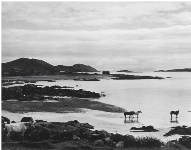
Tir a'Mhurain, Isle of South Uist, Outer Hebrides, 1954 [Tir a'Mhurain, isla de South Uist, Hébridias Occidentales, 1954] Plata en gelatina Colecciones Fundación MAPFRE